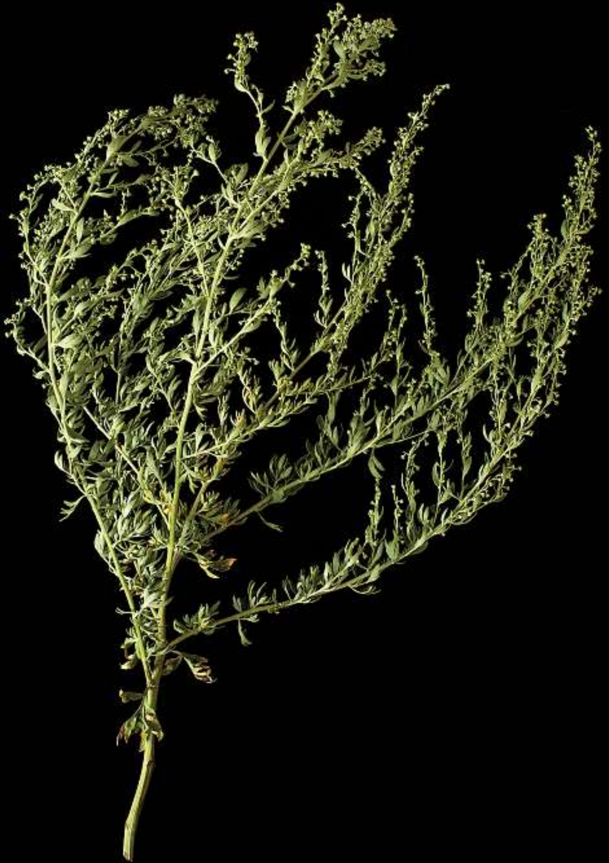
Artemisia Absinthium / Wermut Herkunft: Schweiz (Wallis)