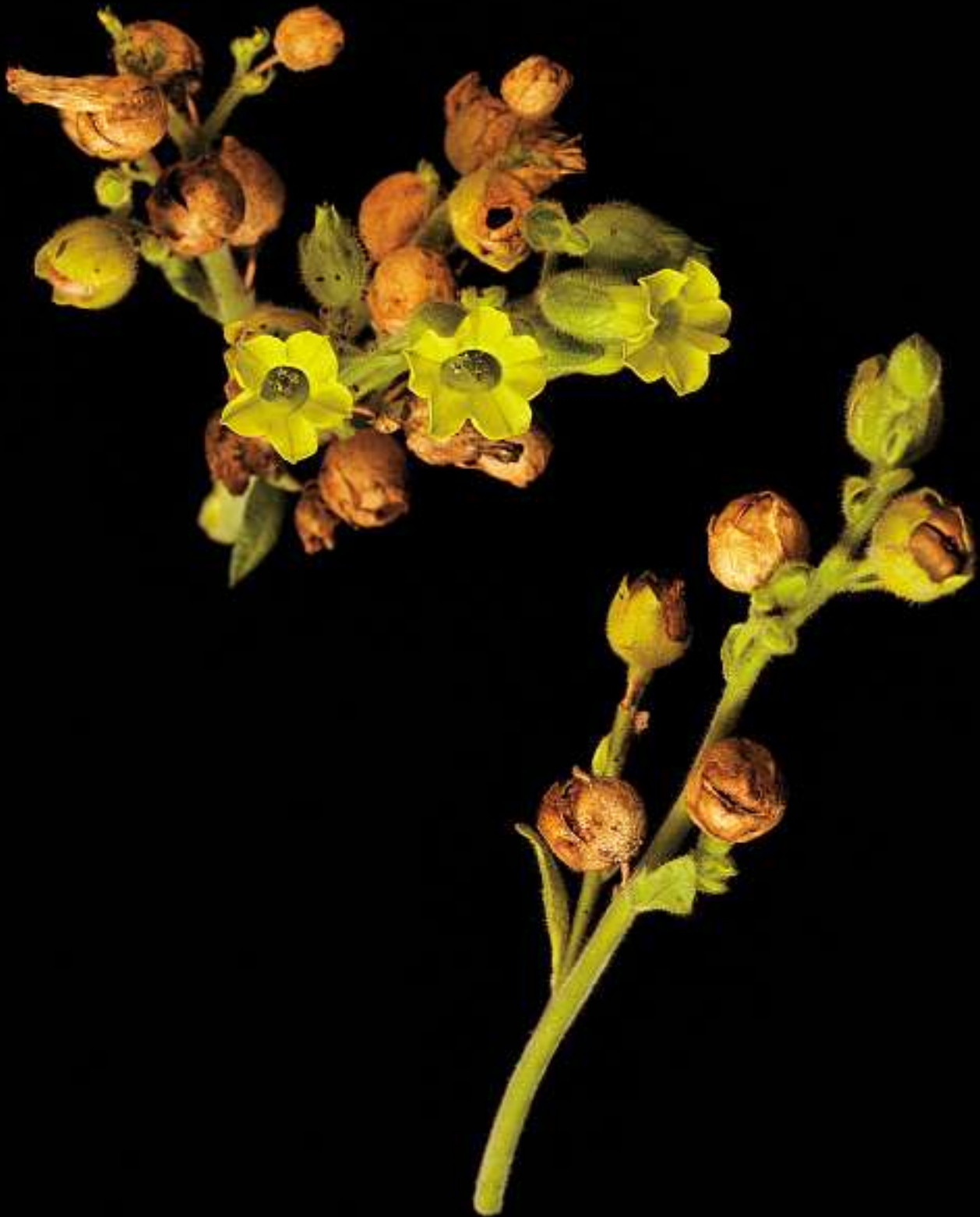
Nicotina Rustica / Bauerntabak

Herkunft: Mexiko, nördl. Südamerika, Anden