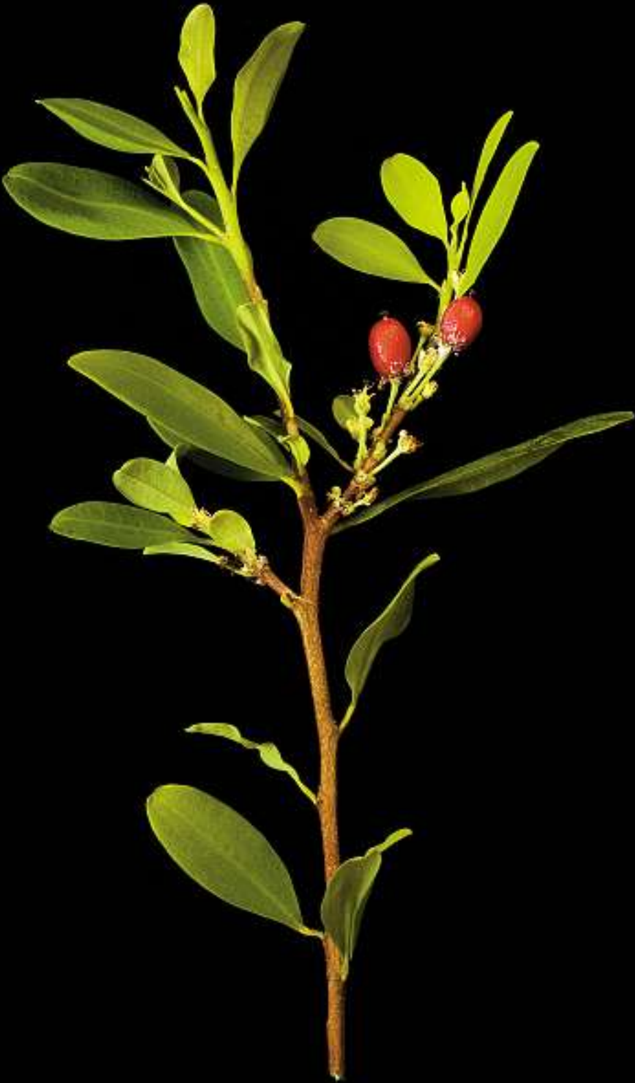
Erythroxylum Coca / Kokastrauch Herkunft: Peru, Bolivien