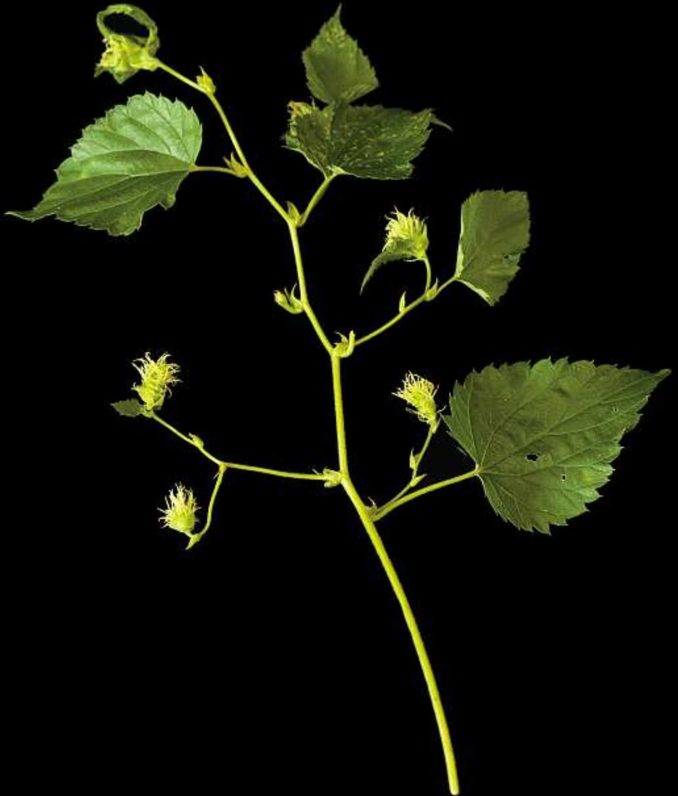
Humulus Lupulus / Hopfen Herkunft: Nördl. Eurasien